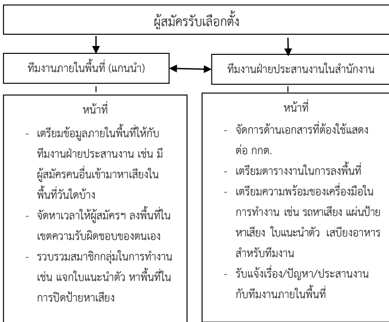
แผนภาพที่ 2 รูปแบบการจัดผังทีมงานหาเสียงเลือกตั้ง

จัดการด้านเอกสาร รายละเอียดด้านค่าใช้จ่ายที่ต้องแจกแจงให้กับกต.รับทราบเพื่อไม่ให้เกินงบประมาณที่ได้กำหนดไว้ รวมไปถึงจำนวนป้ายหาเสียงที่ใช้ในแต่ละครั้งก็ถูกกำหนดไว้เช่นกัน การจัดโครงสร้างภายในที่ทีมงานหาเสียง จะการจัดโครงสร้างอย่างไม่เป็นทางการ โดยแบ่งแยกออกเป็น ทีมงานภายในพื้นที่ หรือจะเรียกว่ากลุ่มที่เป็นแกนนำในพื้นที่ และทีมงานฝ่ายประสานงานในสำนักงาน ทั้งสองส่วนทำงานติดต่อประสานงานซึ่งกันและกันโดยแต่ละฝ่ายมีหน้าที่ของตนเองแต่ยังคงทำงานขึ้นตรงกับผู้สมัครรับเลือกตั้ง (ตามแผนภาพที่ 2)